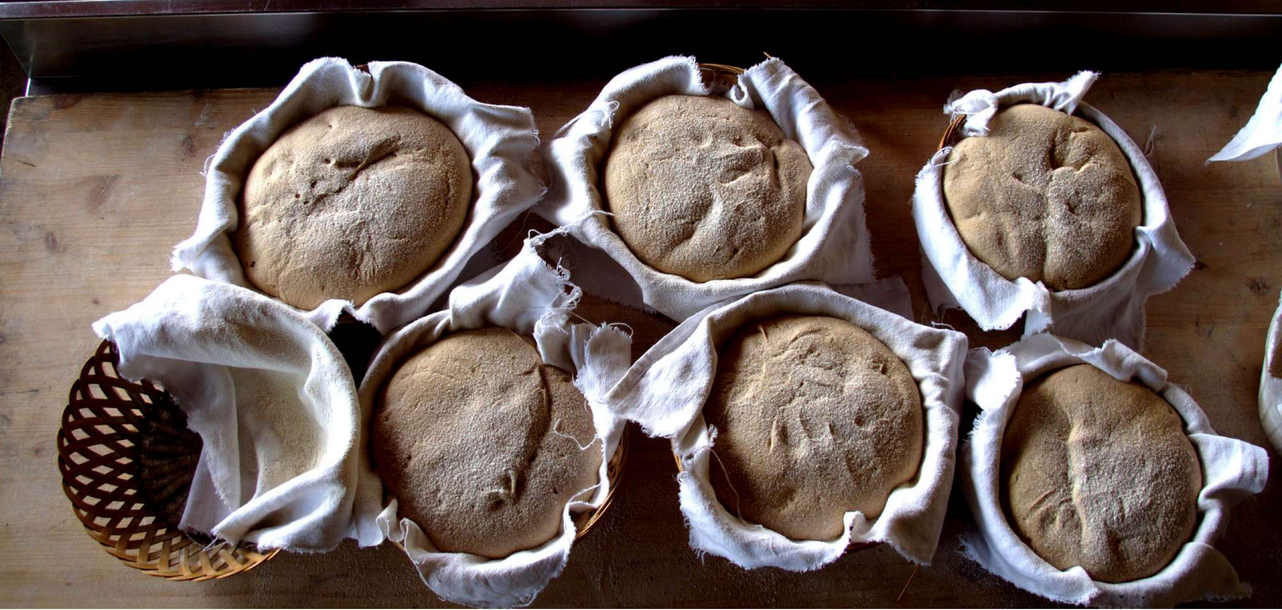
Pane a lievitazione naturale con farina di Grani Antichi