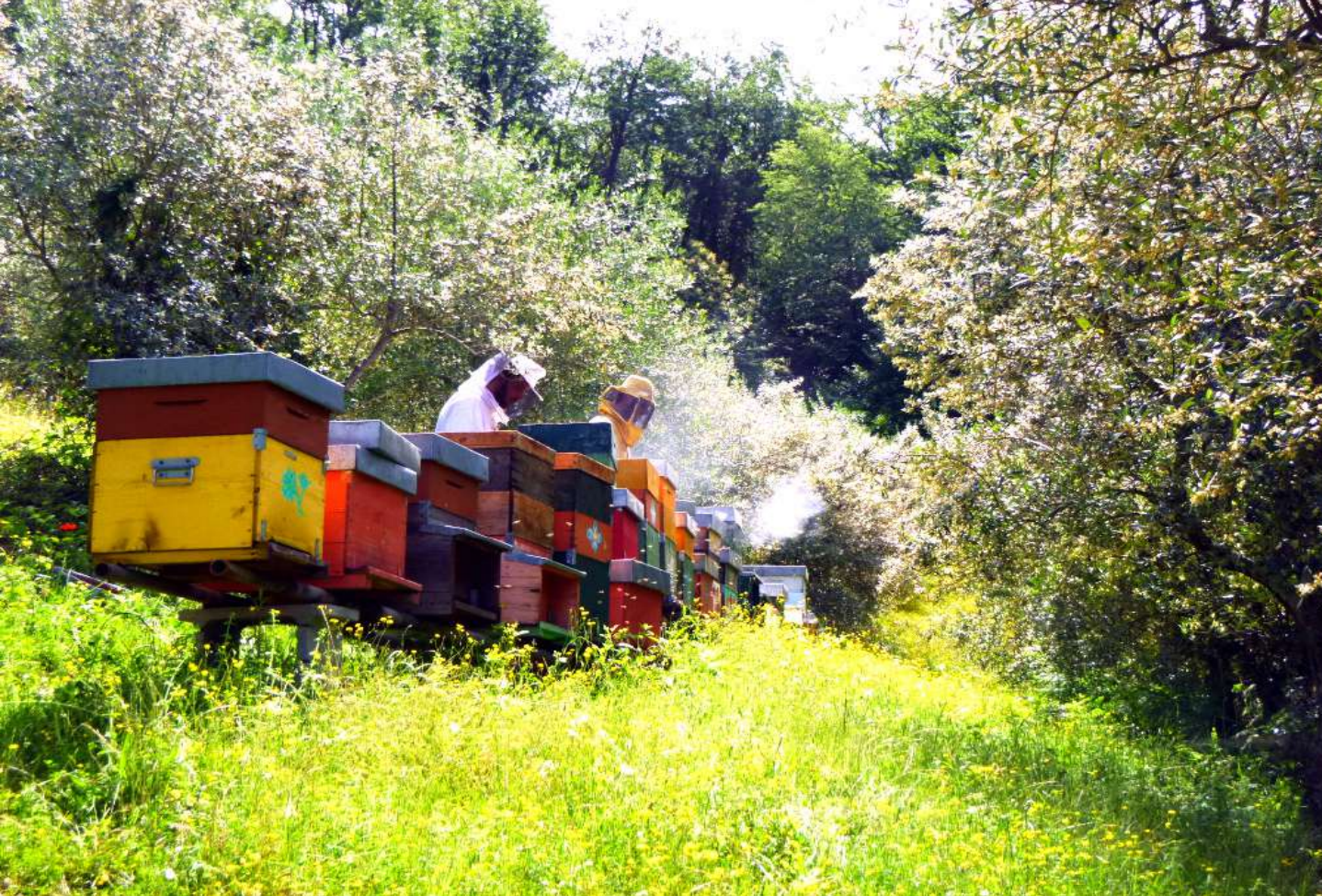
Apicoltura ed Erboristeria