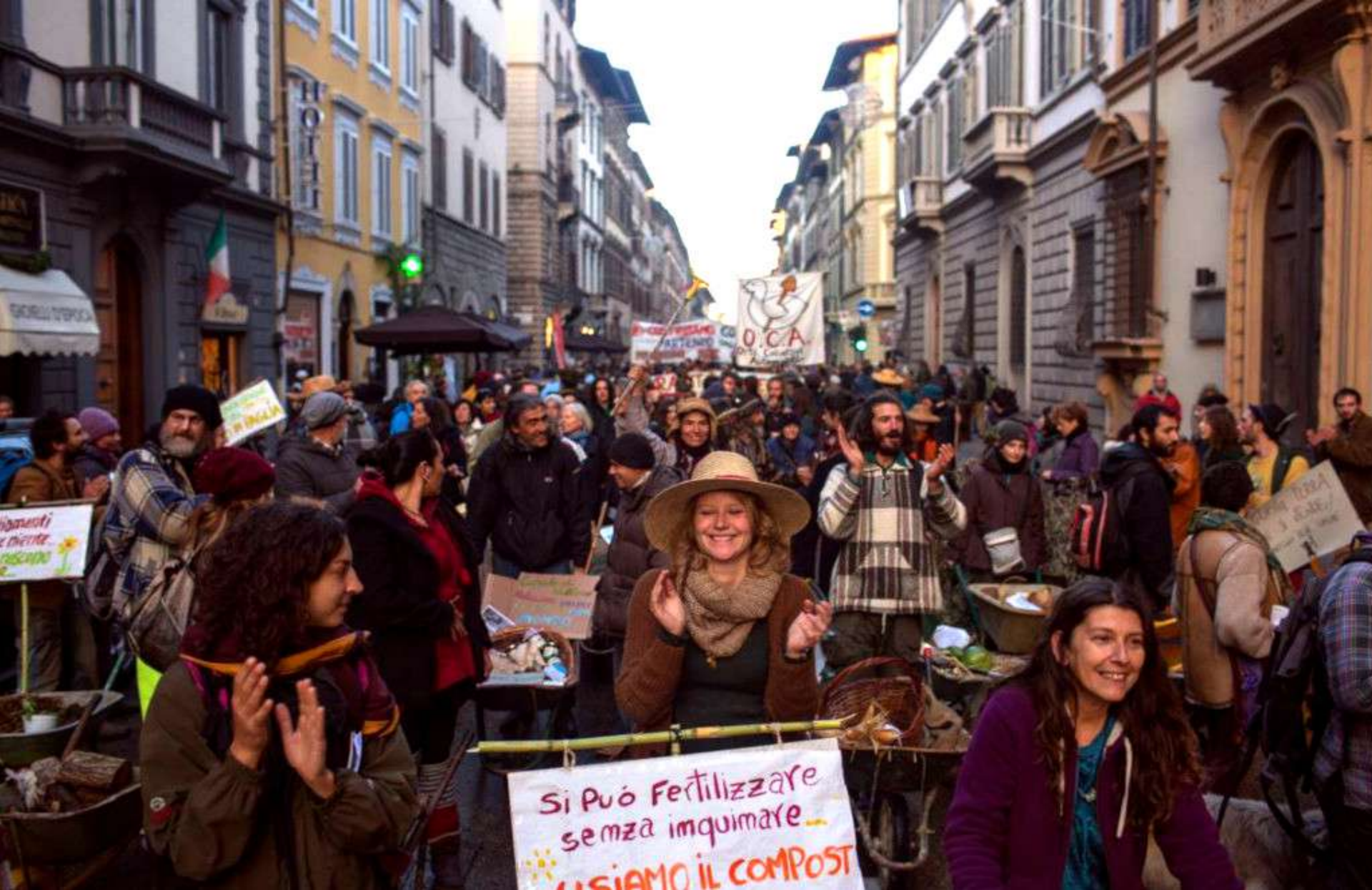
Manifestazione contro la vendita