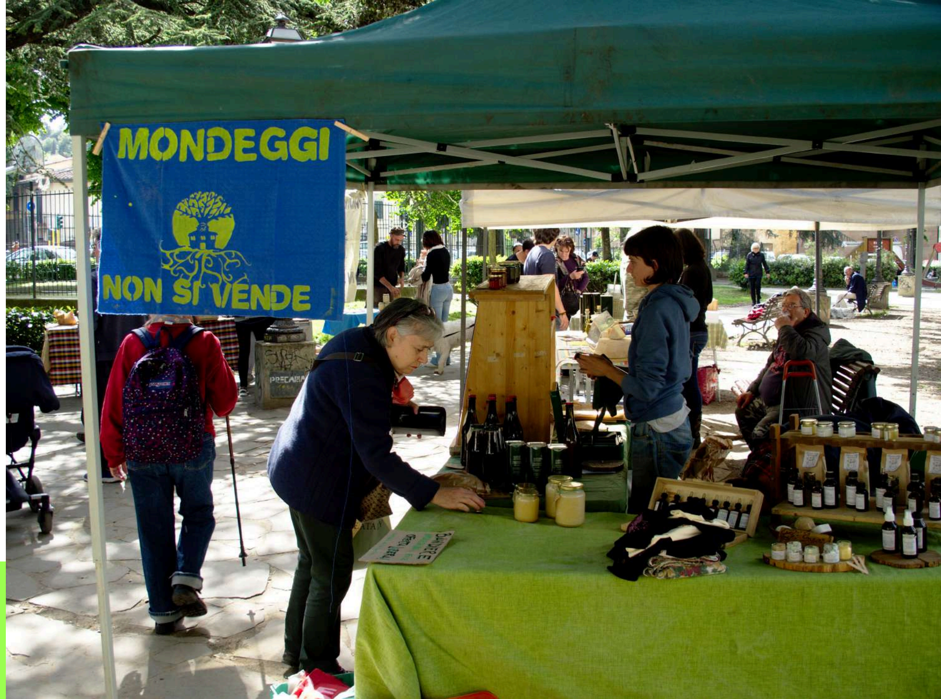
Mercato Contadino in Piazza Tasso, Firenze